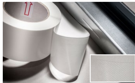
3. Úzky lepiaci pás pásky je potrebné priložiť tesne k profilu