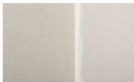
9. Trvalo fungujúce napojenie priliehajúcich konštrukcií